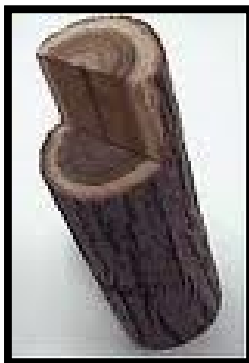
Ένα ξύλο γερό και χοντρό από ελιά ή πεύκο