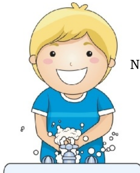
Να πλύνω τα χέρια μου