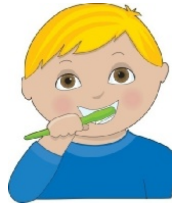
Να πλύνω τα δόντια μου