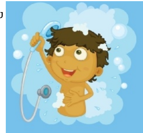
Να κάνω μπάνιο