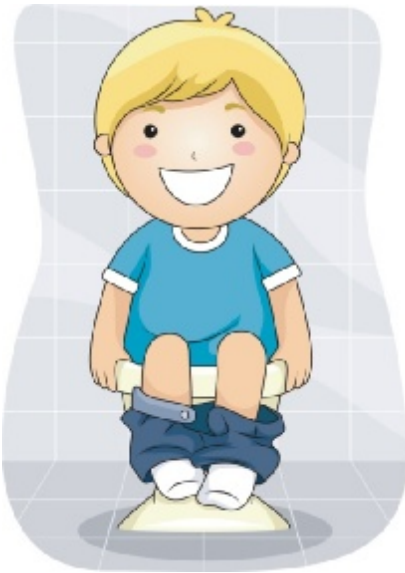
Να πάω στην τουαλέτα